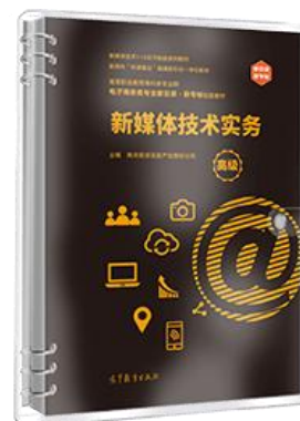
新媒体技术实务（高级）