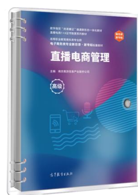
直播电商管理（高级）