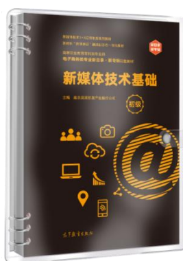
新媒体技术基础（初级）