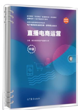
直播电商运营（中级）