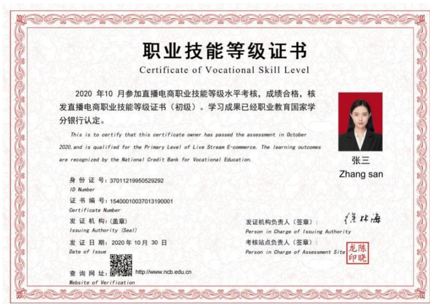
(直播电商职业技能等级证书样例)

直播电商职业技能等级证书 围绕在网络直播营销平台中以产品和服务交易为核心开展的各项经营和管理活动，高度凝练 9 大工作领域、30 个工作任务、104 个技能点，融入直播电商行业发展过程中产生的新模式、新要求、新规范，以培养数字经济时代背景下的复合型技术技能人才。