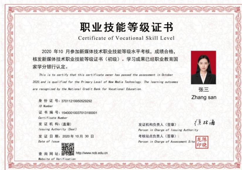
(新媒体技术职业技能等级证书样例)